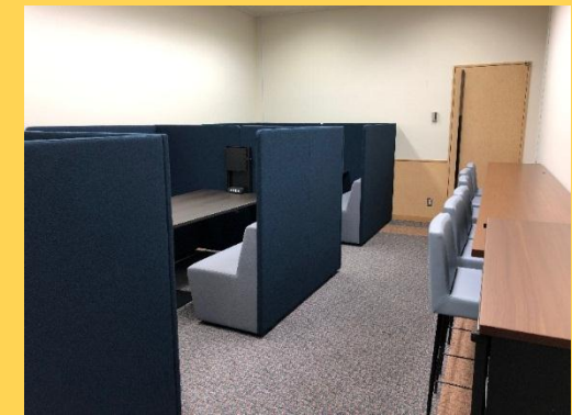
B102(上写真)は 共用来客スペースとして利用できます。