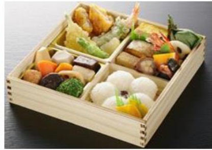
21cm × 21cm × 5.5cm 2,627円