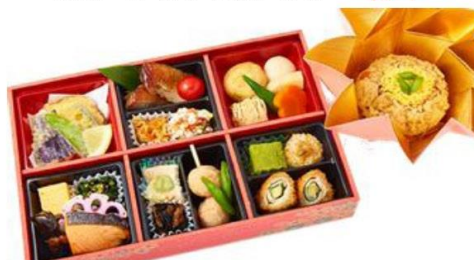
No.111 みおつくし幕の内～花車～