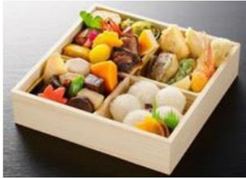
19cm × 19cm × 5.5cm 3,147円