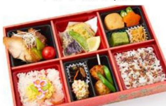
No.110 みおつくし 肉膳