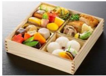
19cm × 19cm × 5.5cm 4,196円