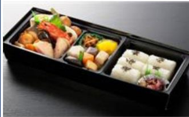
33cm × 12.5cm × 4.5cm 1,894円