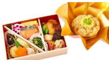
No.103 演舞場幕の内～花車～