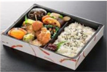
21.5cm × 6.5cm × 4cm 1,262円