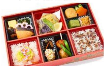
No.109 みおつくし 魚膳