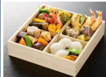
19cm × 19cm × 5.5cm 5,245円