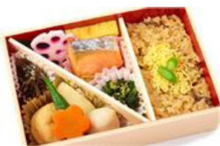
No.102 演舞場炊込み御飯