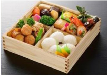
19cm × 19cm × 5.5cm 2,098円