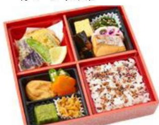
No.104 わかな 魚膳