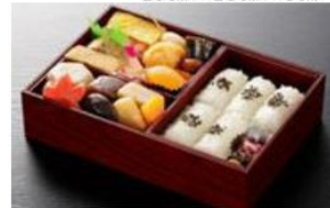
No.014 はぎ -HAGI- 1,425円