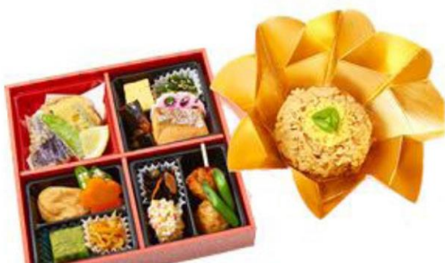
No.106 わかな 魚膳～花車～