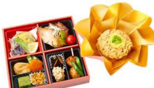
No.107 わかな 肉膳～花車～