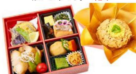
No.105 わかな幕の内～花車～