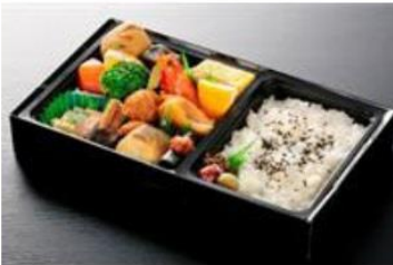
25cm × 14.5cm × 4cm 1,578円